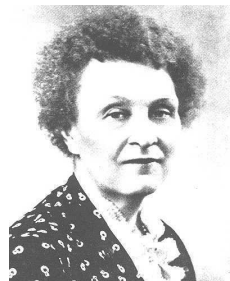
Helen Parkhurst: oprichtster van het Daltononderwijs in het stadje Dalton in Amerika.

Een voorwaarde om verantwoordelijkheid te kunnen nemen is weten wat er wel en niet mag, hoe doen we de dingen. Volgens een vast patroon (hele school) worden deze 'hoe doen we het' kaarten aangeboden. Bij de ingang van de school hangen deze kaarten en in elke klas.