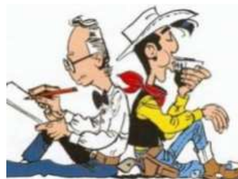
Papa in de klas bij de 'Daltons'.

Beste ouders, heel erg bedankt voor jullie komst en voor de leuke reacties!! Leerkrachten gr 3-4-5